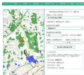
施肥設計試算シート