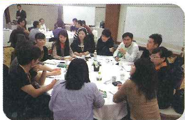
青年意見交換会で日中両青年が設定したテーマについて協議