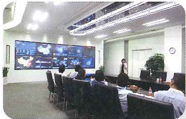
コース別現地企業研修では、米国で上場し話題となったアリババ訪問