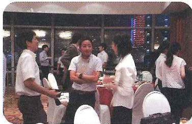
交流夕食会では、上海等で活躍する邦人と情報交換