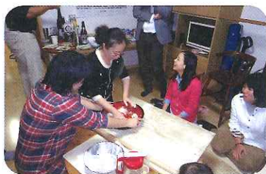
ホームステイで蕎麦打ち体験をする日中両青年