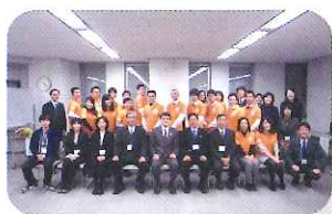
製作したお揃いのポロシャツを着て記念撮影

「中国人の向上心を感じ、自分の生き方自体を考えるきっかけになった。」 「個人では絶対に体験できないようなホームステイ、企業訪問ができ、有意義な半年間であった。」 「中国の現状を知り、交流ができただけでなく、日本・静岡県の魅力を見つめ直す機会にもなった。」