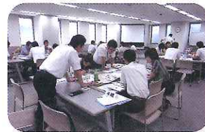
第2回セミナーのグループワーク