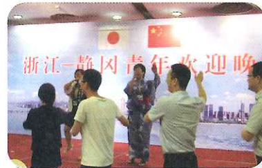
歓迎レセプションで盆踊りを披露、浙江省青年も一緒に