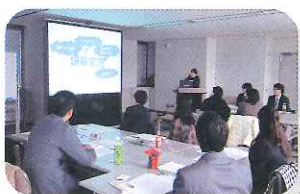
交流の成果と「日中交流架け橋プラン」を発表

「交流報告会」では、交流の成果と、今後日中交流に継続的に寄与していくためのプラン（日中交流架け橋プラン）を発表し、本交流の成果とプランについてグループディスカッションを行いました。