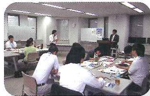
第1回セミナー「中国事情講座」後の質疑応答

オリエンテーションと浙江省交流に向けたガイダンス、講義、中国語講座、グループワークなどを行いました。