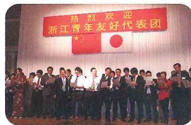
浙江青年友好代表団歓迎レセプションで「朋友」を全員で合唱